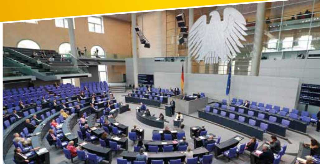
Am 23. Februar wird der neue Bundestag gewählt.

Liebe Gladbeckerinnen, liebe Gladbecker,