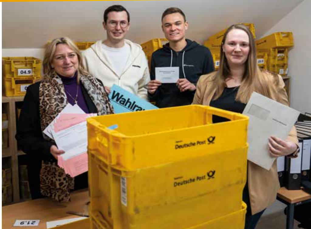
Die Mitarbeiter:innen des Wahlteams haben in den Wochen vor der Bundestagswahl alle Hände voll zu tun.